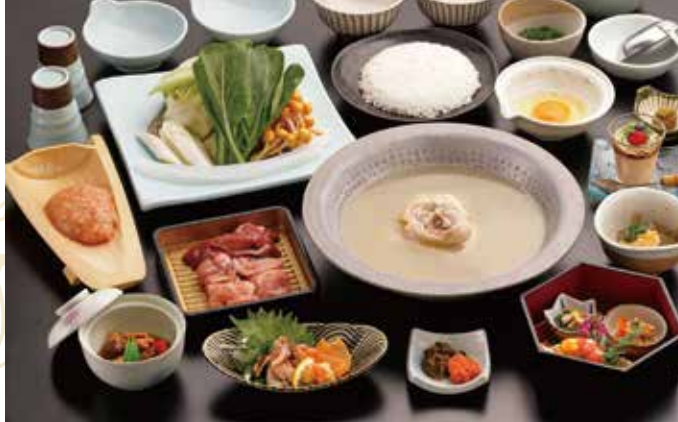
* 照片显示的是华套餐。