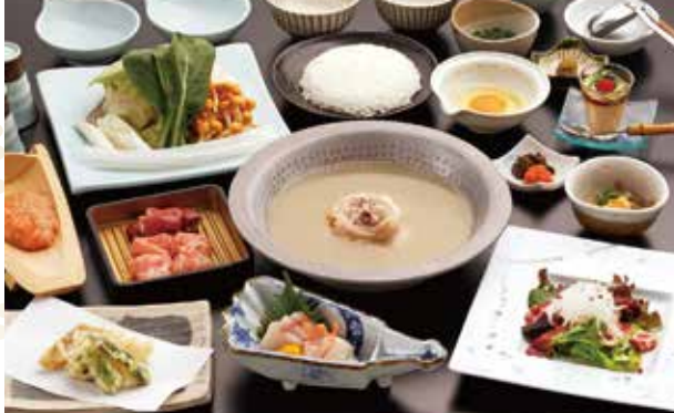
* 照片显示的是凤凰套餐。